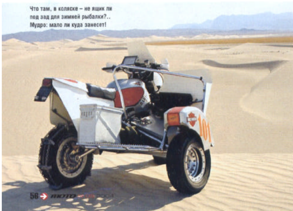
Что там, в коляске – не ящик ли под зад для зимней рыбалки?.. Мудро: мало ли куда занесет!

Автор выражает благодарность Скотту УИТНИ за помощь в подготовке материала.